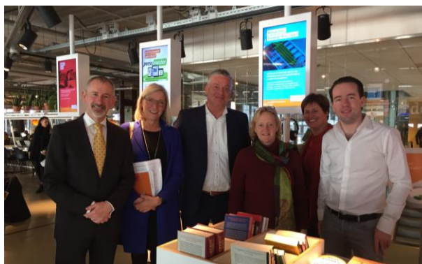
Foto 5 Werkbezoek in Rotterdam