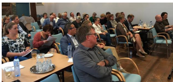
Foto 2 Cao-bijeenkomst 23 oktober

De uitkomsten van de acht werkgroepen werden teruggekoppeld aan de cao-tafels COAOB en OAK. Op basis van de werkgroep-bijeenkomsten liggen er inmiddels voor een deel van de cao, teksten in ruwe vorm. Partijen hebben zich uitgesproken voor helder, toegankelijk en actief taalgebruik en een overzichtelijke indeling. Om vaart in het proces te houden, zochten de cao-tafels een externe procesbegeleider voor het traject. Eind 2018 organiseerden we samen met de FNV een bijeenkomst voor werkgevers en werknemers om met elkaar in gesprek te gaan over de toekomst en modernisering van onze cao.