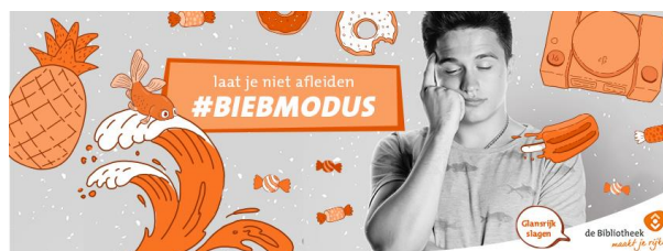
Beeld 1 Omslag Facebook #BIEBMODUS

positioneringscampagne 'de Bibliotheek maakt je rijker'.