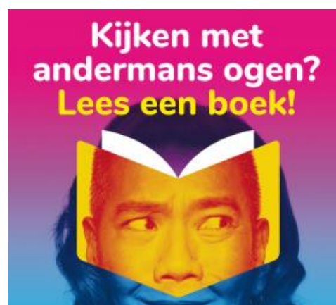
Beeld 5 Poster Lezen met andermans ogen

Om mensen te inspireren vaker een boek te lezen dat hen met andere ogen laat kijken, lanceerde de Leescoalitie de campagne en website 'Lees met andermans ogen'.