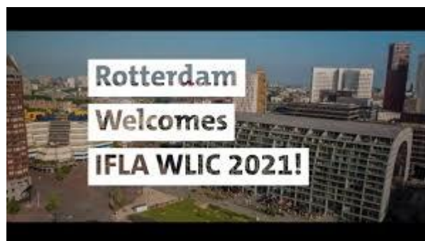
Beeld 4 Still van promofilm 'Rotterdam Welcomes IFLA WLIC 2021'

Bibliotheek Rotterdam heeft samen met de VOB, de KB, Erasmusuniversiteit en Stichting Samenwerkende POI's Nederland, een aanbieding gedaan aan IFLA om de World Library and Information Congress (WLIC) van 2021 te organiseren. Met het filmpje 'Let's work together... in Rotterdam!' presenteerden we ons aan de wereld.