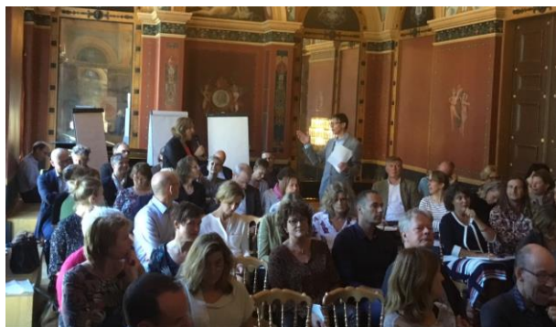
Foto 4 Bijeenkomst Meervoudig verantwoord

Dit project startte in de tweede helft van 2015 onder de titel 'Nieuw Rekeningschema'. Tijdens het project bleek dat het rekeningschema goed aan te passen was, maar dat effectmeting en verantwoording vernieuwd moesten worden. Het project ging verder onder de titel 'Meervoudig Verantwoord'. Er verschenen een aantal handreikingen en de stuurgroep stelde een standaard voor kostentoedeling vast die met bibliotheken in de proeftuinen werd gemaakt.