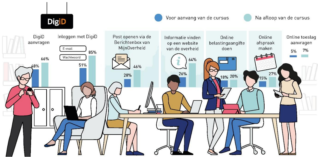
Figuur 2: Percentage cursisten dat aangeeft een bepaalde digitale vaardigheid te kunnen toepassen op het gebied van overheidszaken, voor en na de cursus.